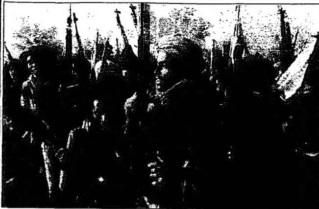
جنود اريتريون على جبهة القتال (الريديتا)

■ مسرعة، فبإفاد مصدر دبلوماسي عربي أن زيارة وفد رفيع المستوى من منظمة الوحدة الافريقية الى الخرطوم لمتابعة المفاوضات الافريقية لفرصة اخيرة لحل النزاع بين اثيوبيا واريتريا. وفي حال لم يفضّل هذا الخيار، فإن منظمة الوحدة الافريقية ستضطر الى اتخاذ اجراءات اخرى، بما في ذلك فرض عقوبات اقتصادية على الجانبين. وقال المصدر ذاته، إن وفد الوساطة الافريقية الذي يقوده وزير الخارجية المصري محمد موسى هاشم، سيصل الى الخرطوم في وقت لاحق من الشهر الجاري. وأضاف المصدر، إن الوفد سيبحث مع الجانبين حول شروط التسوية، بما في ذلك وقف إطلاق النار، وتسليم الاسرى، وتسهيل العودة الى الوطن، وإقامة علاقات دبلوماسية طبيعية. وأكد المصدر، إن الوفد سيبحث مع الجانبين حول شروط التسوية، بما في ذلك وقف إطلاق النار، وتسليم الاسرى، وتسهيل العودة الى الوطن، وإقامة علاقات دبلوماسية طبيعية.